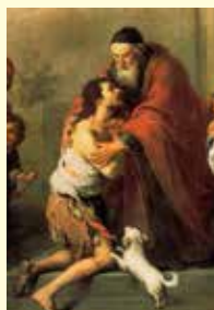
Il figlio perduto e ritrovato.